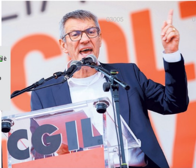
Il leader Maurizio Landini è il segretario generale della Cgil dal gennaio 2019. In precedenza è stato il numero uno della Fiom