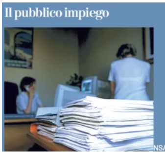
Il pubblico impiego