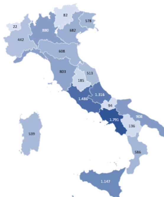
Rappresentazione grafica della ripartizione a livello regionale delle risorse dei Programmi di cui al DM MEF del 15 luglio 2021 in mln €

Con tecnologia Bing © GeoNames, Microsoft, TomTom